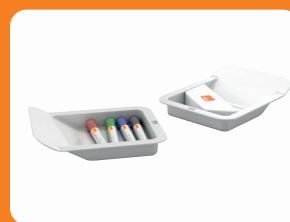
Verwijderbare accessoire trays